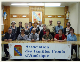
Assemblée générale annuelle 2012